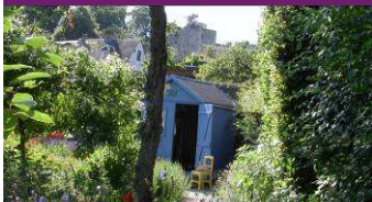
L'Herbarium des Remparts