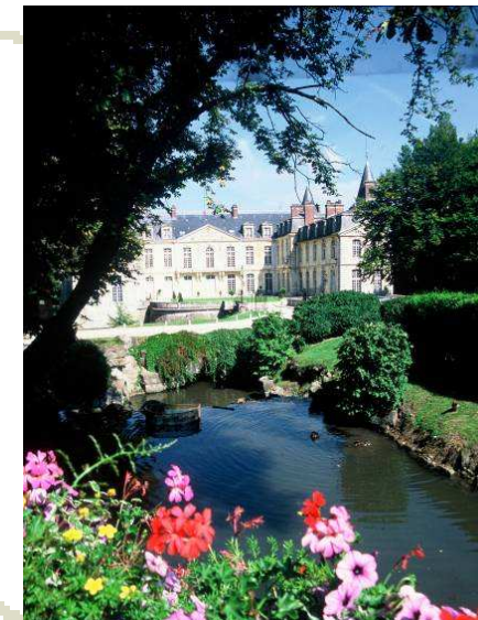
Jean-Charles Morin, guide

Parc Jean-Jacques Rousseau 60950 Ermenonville (carte : C) Tél : 03 44 54 96 67 www.cg60.fr