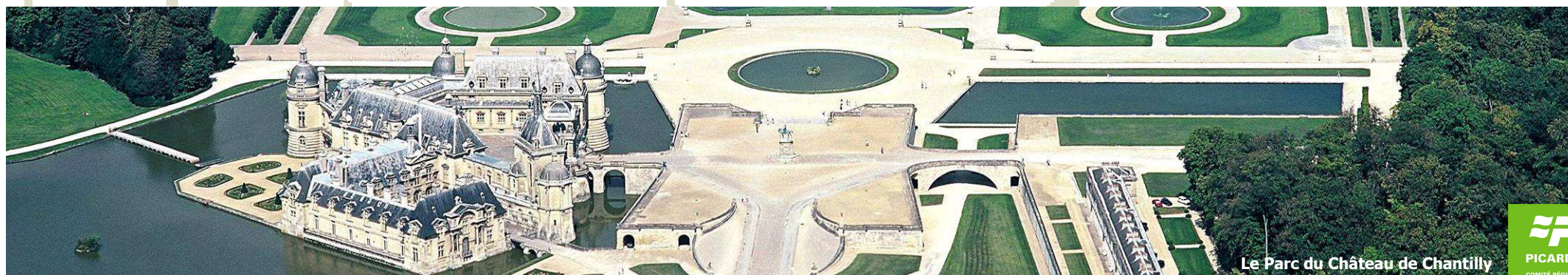
Le Parc du Château de Chantilly